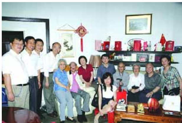
2009年，徐献瑜教授百岁寿辰留念

徐献瑜教授就这样静静地离开，但是他卓越的学术成就与淡然的为人之道，会永远留在后辈的记忆之中，不停地传承下去，发扬光大。